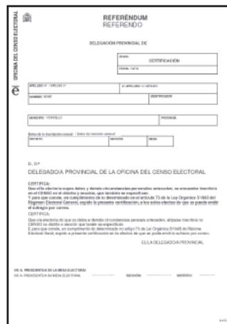
MODELO DE CERTIFICADO DE INSCRIPCIÓN NO CENSO